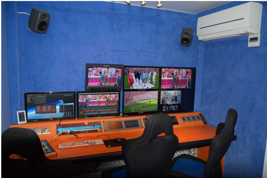
Schnittplatz 1 und 2 sind identisch ausgestattet