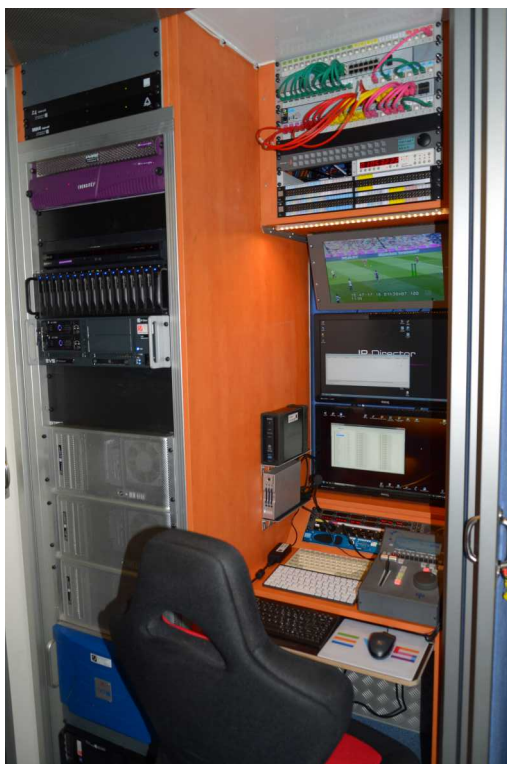
Adminplatz mit zentralem Ingest